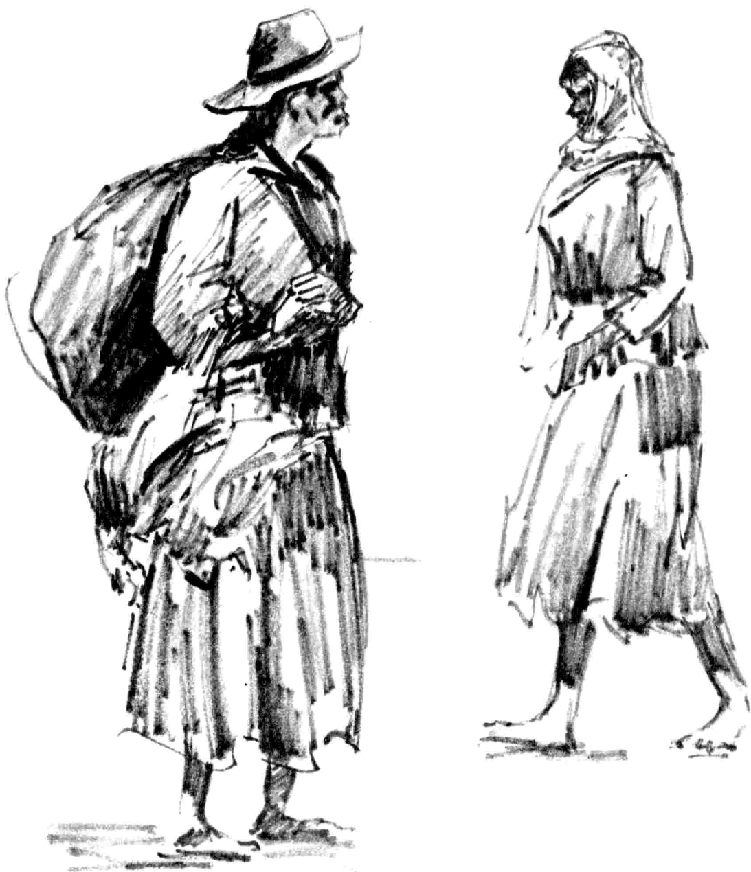
Feria de la Candelaria. Una vendedora de pollos.