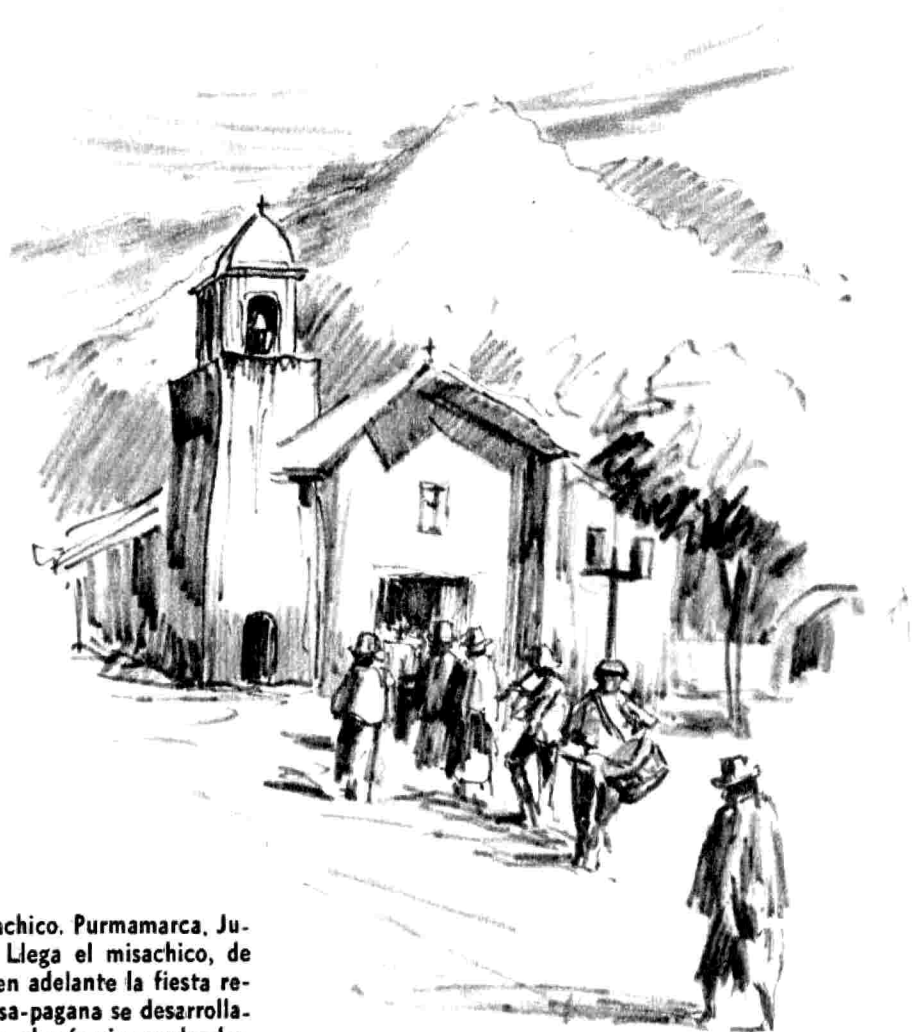
Misachico, Purmamarca, Jujuy. Llega el misachico, de ahí en adelante la fiesta religiosa-pagana se desarrollará en el más vivo esplendor.