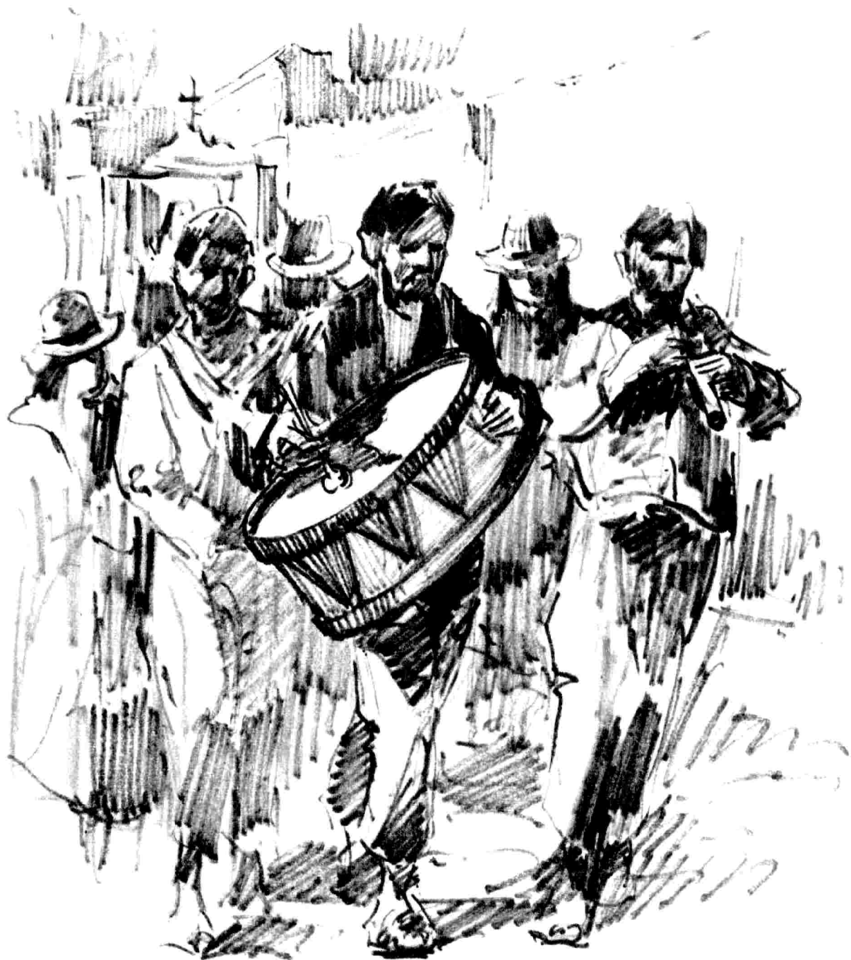
Misachico. Jujuy. Bombos, anatas, etc., son los instrumentos más usuales en la banda que acompaña la ceremonia.