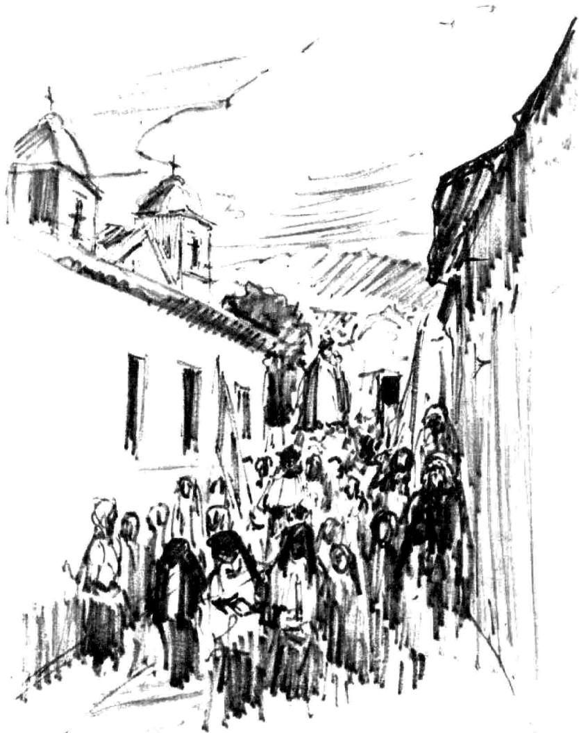
Procesión de la virgen del Valle. Humahuaca, Jujuy. Vista de la misma, mientras desfila a través del pueblo.