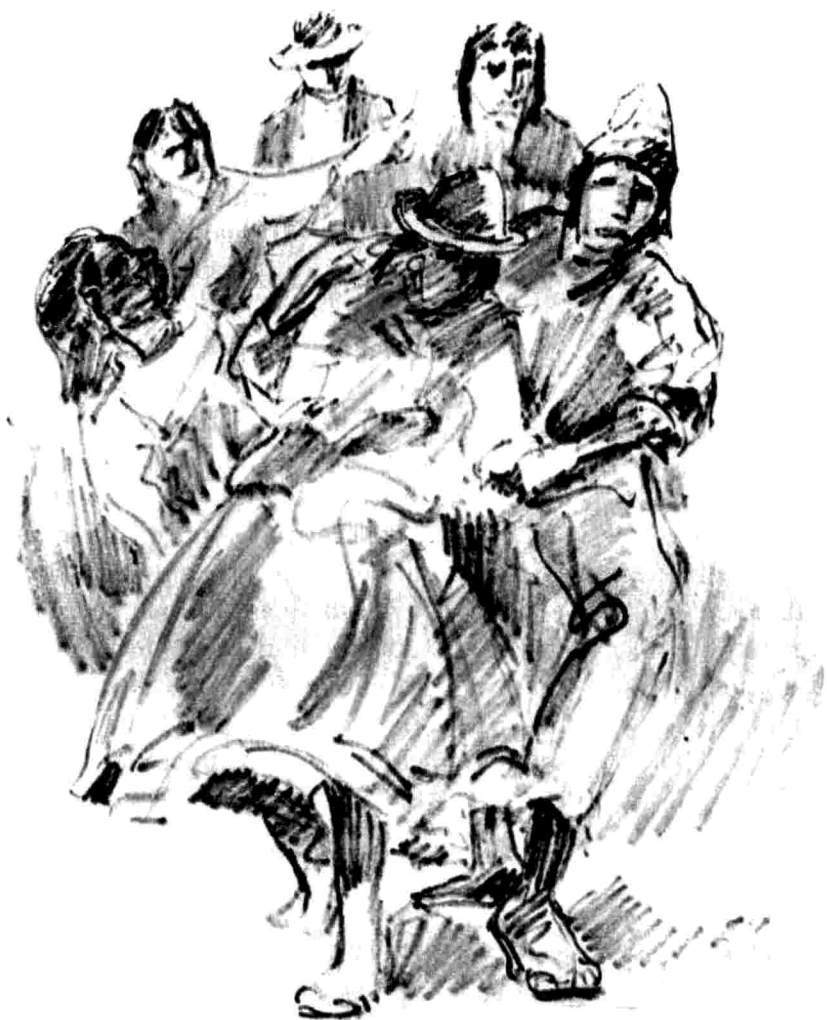
Carnaval. Aspectos generales de las danzas celebradas en los distintos días de fiesta carna- valesca.