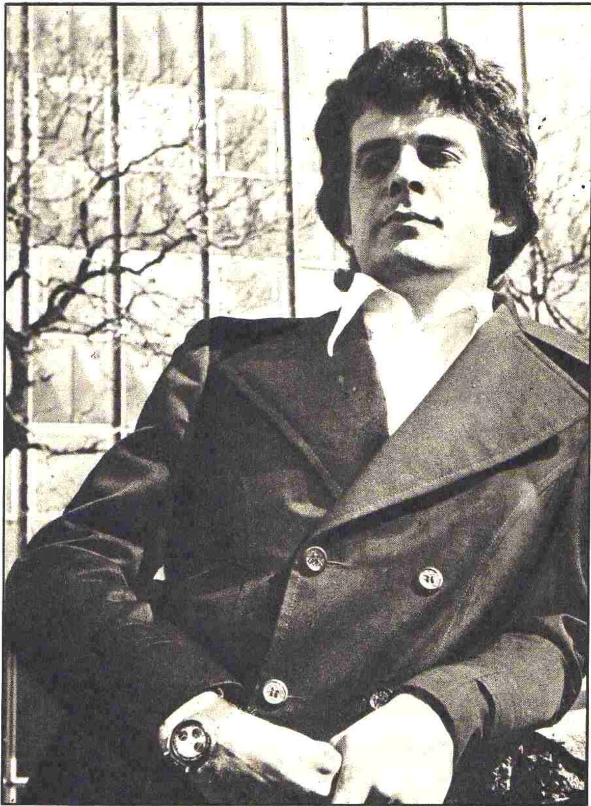
Antonio Tarragó Ros