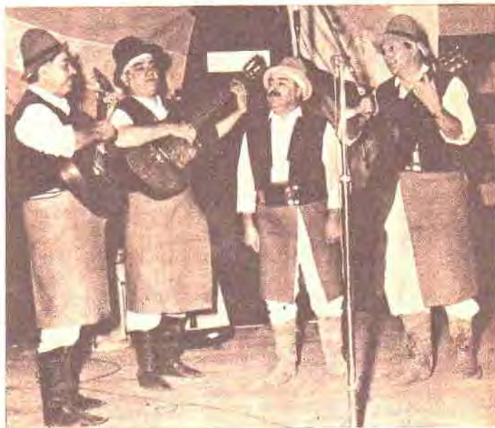
Un conjunto singular: "Los Carreteros". Vestidos a la usanza de los montoneros reflejan en sus canciones momentos de la historia uruguaya.