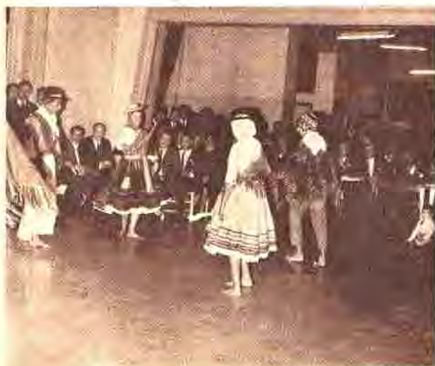
EL CUERPO DE BAILE DE "EL CIELITO" INTERPRETO EN FORMA BRILLANTE LAS DANZAS DEL ALTIPLANO