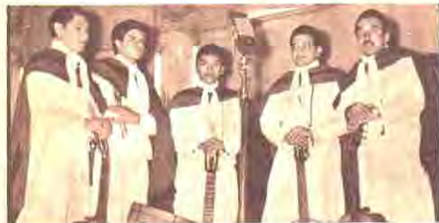
TAMBIEN LOS NOMBRADORES SUPIERON CONQUISTAR EL APLAUSO DEL PUBLICO URUGUAYO.

La gran fuente de difusión del folklore en Montevideo es aún (a pesar del auge de la TV) la radio. Intentaremos dar una muy breve reseña de las actividades de las distintas audiciones que ya son populares en Montevideo.