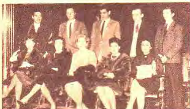
Las delegaciones de las peñas del Club Náutico San Fernando y de la "docta" Córdoba, posan para FOLKLORE con motivo de su visita a los estudios de CX 14 Radio El Espectador.

por ENRIQUETA COSTANTINI y LUIS A. RODRIGUEZ ROQUE