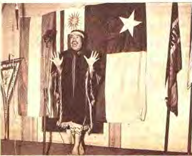
"EL PAMPA", CON SU INDMENTARIA COYA EN UNA EXPRESIVA ACTITUD

Las Jornadas de Derecho Civil realizadas recientemente en Montevideo motivaron, entre otros actos de agasajos, una Peña de confraternidad realizada en el Club Municipal de aquella ciudad.