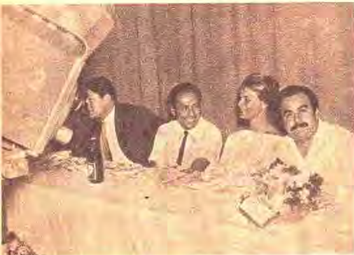
HORACIO GUARANY EN "ALMUERZO CON LAS ESTRELLAS", POR SAETA TV CANAL 10, DONDE FUE ENTREVISTADO JUNTO A "LOS CANTORES DEL ALBA".