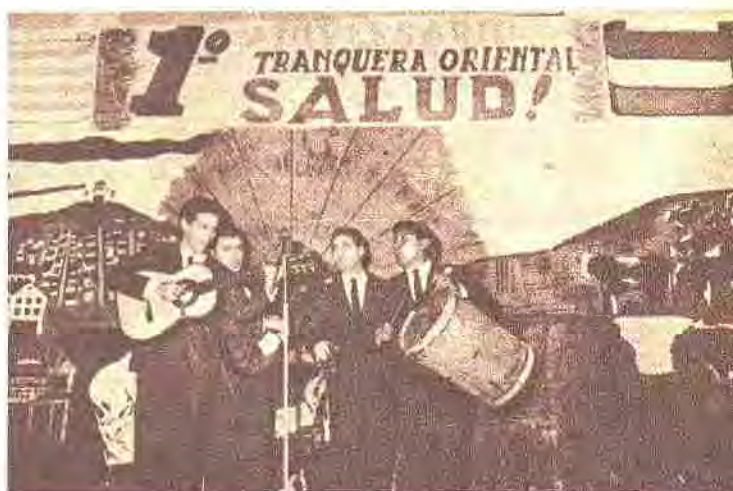
"Tranquera Oriental", programa de Radio El Espectador los recibió con los brazos abiertos a los integrantes de este famoso conjunto salteño.