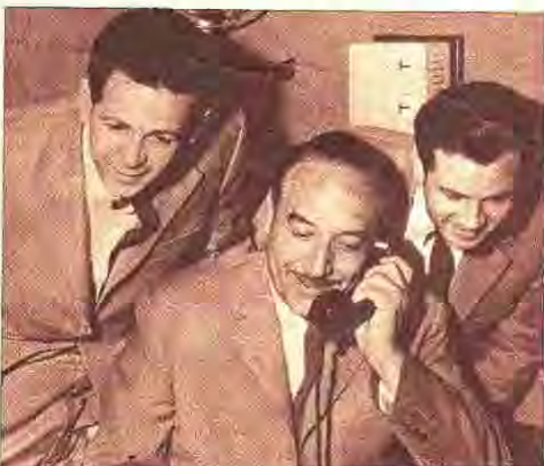
Los Estrelleros: agotan discos y se preparan para dar cumplimiento a las numerosas solicitudes de que son objeto del interior del Uruguay.