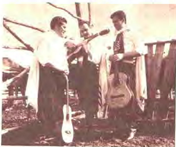
El conjunto Vozes de América, que lograron una medalla de oro en Porto Alegre, premio otorgado al mejor conjunto de la temporada 1961.