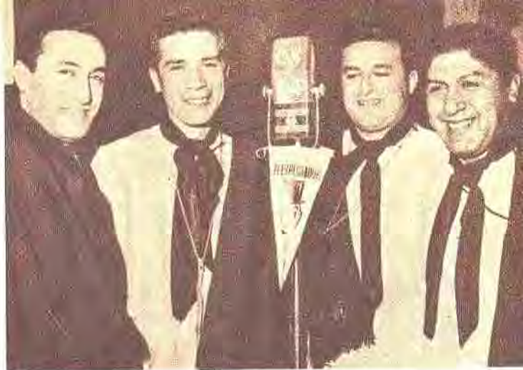
El micrófono que permitió a "Los Fronterizos", llegar con sus canciones a todo el Uruguay: CX14 Radio El Espectador.