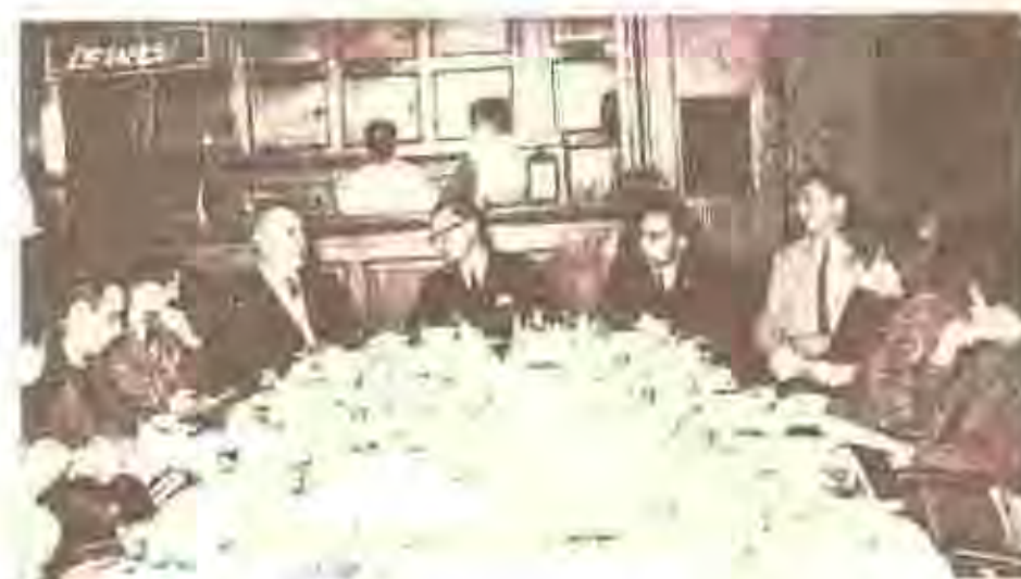
Una instantánea gráfica tomada durante la conferencia de prensa desarrollada en el hotel Nogaró de Montevideo.