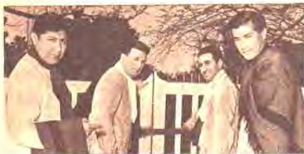
EN EL MES DE JULIO LLEGARAN LOS FRONTERIZOS A "TRANQUERA ORIENTAL".