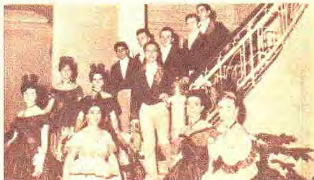
Integrantes de la Peña del Club Náutico San Fernando, sorprendidos por el fotógrafo minutos antes de presentarse en el Festival de Danzas Folklóricas Internacionales.