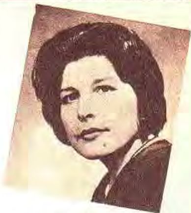
MERCEDES SOSA, "La voz de la Zafra", artista tucumana que cumple brillante temporada en Uruguay, en radio y TV.

Este popular género que día a día se agiganta en la preferencia continental, ha encontrado en tierra uruguaya un baluarte de indiscutible prestigio en CX14 EL ESPECTADOR. Esta emisora oriental, atenta siempre por brindar al público lo que el público reclama, plegándose sin reservas al movimiento iniciado en toda Sudamérica tendiente a rescatar los valores nativos y tradicionales, imprime un nuevo impulso a su programación siempre ascendente y tiene, en sus 20 horas diarias de transmisión, varios espacios dedicados a los motivos que la tierra inspira.