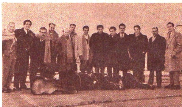
Orientales en Buenos Aires. A poco de pisar tierra argentina, posan Los Carreteros, Los Olimareños y Los Changos de Pucará, integrantes de la delegación de CX14 Radio El Espectador.

Brindis que tuvo la virtud de unir a hombre de ambas márgenes del Plata identificados por una misma vocación folklórica.