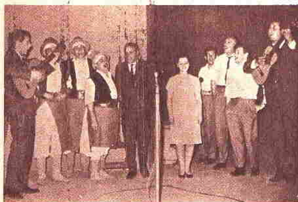
Los Carreteros, Chaya, Los Estrelleros y Maria Rosa, despiden el programa cantando la canción más popular de autor uruguayo en 1963: "Río de los pájaros".