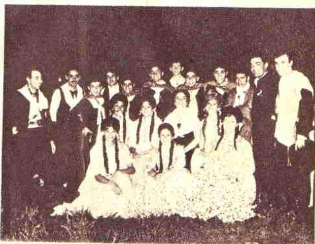
Las parejas de "C.A.I.N.T.I.F.U." liga de acercamiento entre todas las peñas e instituciones tradicionalistas del país, que brillaron en las noches del 27 y 28 en el "Pabellón de las Rosas"

* El éxito de la muestra obligó a planes futuros. Y ya están los ojos fijos en 1965. Piriápolis tendrá su Segundo Festival Criollo de la Canción. Y de acuerdo a lo ya pactado, con un mejor enfoque de las fechas previstas para el mismo, se confía en la superación, en un mil por ciento, de los resultados logrados en los días finales de febrero de 1964. Mientras esperamos con fe en la llegada de un nuevo amanecer folklórico, nuestra esperanza de continuidad del suceso folklórico que expresada aquí, en este trozo de historia que es FOLKLORE.