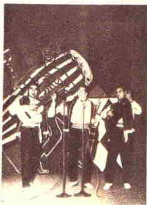
La muestra reunió a nombres como "Los Tres de Oro", a quien vemos en un momento de labor.