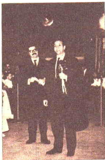
Palabras entrecortadas por la emoción, en la despedida.