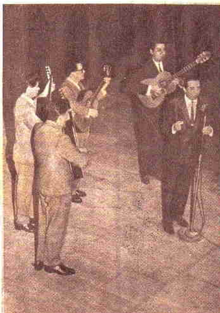
Así se presentó Antonio Tormo con el marco instrumental de Mario Núñez y su conjunto uruguayo de guitarras. El gran intérprete argentino se llevó ovaciones luego de haber interpretado "El jarillero", "La farrá", "Puente Pexoa" y "Los ejes de mi carreta".

a las 7.42 horas: "Mañanitas de Austral"; 11 horas: "Recorriendo la patria"; 13 horas: "Music Hall en el aire"; 17.30 horas: "Mediatarde en Austral"; 23 horas: "Noches Folklóricas", y en cualquier momento: "Variedades", con los éxitos del momento.