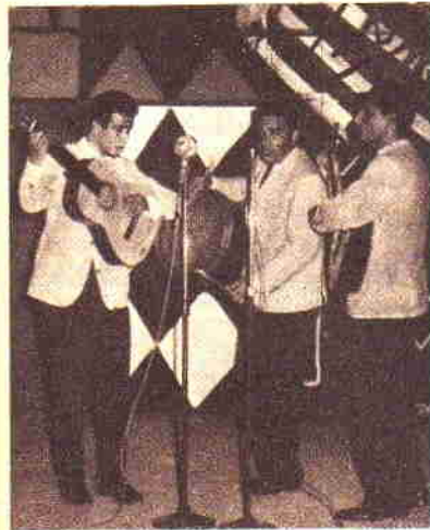
LOS MONTONEROS en un momento de su presentación durante el festival de Piriápolis.