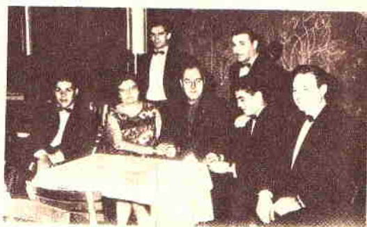
El señor Honegger y señora comparten la mesa con Los Trovadores del Norte.