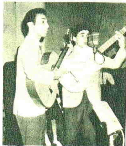
Un dúo de creación reciente, "Los Nativos Orientales", producto de la tradicional peña de los viernes. También fueron evocados en el acto de despedida del programa.