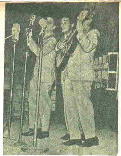
"Los Montoneros" volvieron como en su mejor época, interpretando motivos de raperusión como "La engañera" y "Collar de Caracolas". Se les oyó seguros y con firmes cualidades para continuar la senda triunfal que iniciaran hace algunos años.