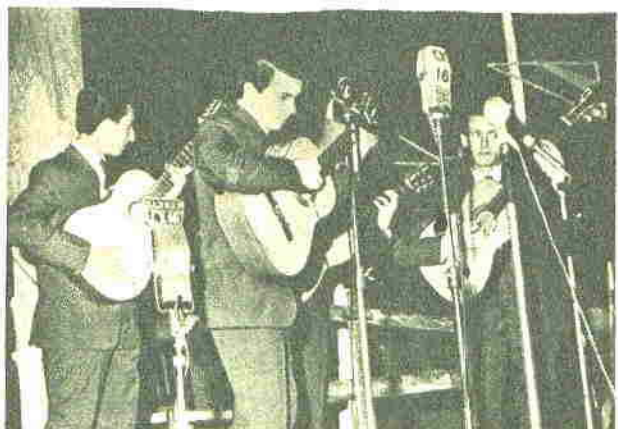
"Los Tarumeños" aportaron sensacional nota al interpretar el candombe "Baile de los morenos", otrora suceso de Romeo Gavioli.