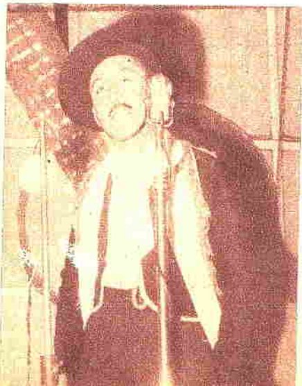
"Paisaje sureño" y "Los ejes de mi carreta" determinaron el aplauso espontáneo del público que siguió las actuaciones de "Cuatro para el Folklore"