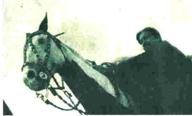
Guarany es un hombre campero. Lo demostró en Bella Vista y en la gran marcha del 19 de abril, recorriendo kilómetros y kilómetros para realizar emocionantes homenajes a los "Treinta y Tres Orientales", "El Gaucho", "General Artigas" y "General San Martín", al pie de esos monumentos que los perpetúan. La Semana Criolla marcó importantísima etapa en la consagración popular del trovero.

Eso va como prólogo a la realidad del Turismo Criollo oriental. El trovero llegó al mismo lugar de haber intervenido como único folklorista en la Fiesta de la Televisión realizada en Alta Gracia. Un mundo de gente estaba esperando su arribo. Y la lluvia también. Pero ésta no fue circunstancia para que aquella se diera por vencida. No, señor. Y concurrió como en tropel hasta la Criolla de Bella Vista, un lugar típicamente a tono, para otor-