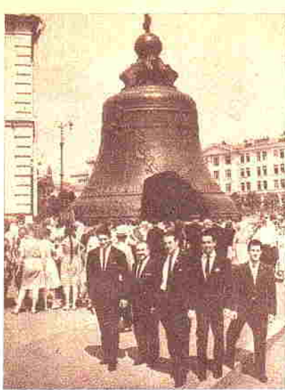
CAMPANA GIGANTE de la época de Iván, cuyo peso es de 200 toneladas. Tiene seis metros de diámetro por otros seis de altura. Y el "trozo" que le falta, y que está caído al lado de la campana (en la foto impedido de visión por la muchedumbre), pesa once toneladas. Esta campana está ubicada dentro del Kremlin.

que tenga sabor folklórico. Conceptos como éstos pasan al cuadernillo de apuntes. Y de éste, a las páginas de FOLKLORE.