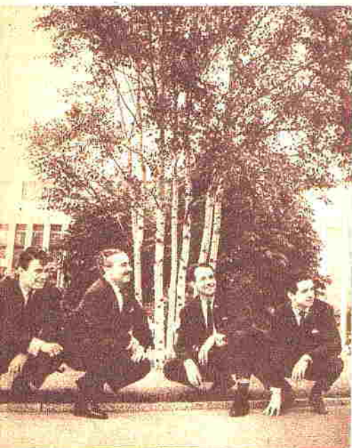
"LOS CARRETEROS", y detrás de ellos el "Abedul", árbol nacional de la Unión Soviética.