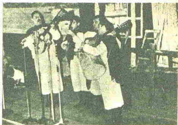
Los que no pasan nunca: "Los Chalchaleros". Ahí están Dávalos, Cabeza, Saravia y Víctor Zambrano, en una de sus muchas interpretaciones. Fueron artistas exclusivos de la misma en su transcurso.