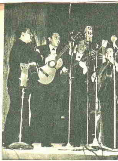
"Los Tucu Tucu", otros grandes triunfadores en las veladas del moderno estadio cerrado del Club Parque del Plata. "Ay niña", "Cuando ya nadie te nombre", "Mariposita", "Trasnochados espineles" y otros sucesos de su repertorio, provocaron el entusiasmo de un público que nunca decayó.