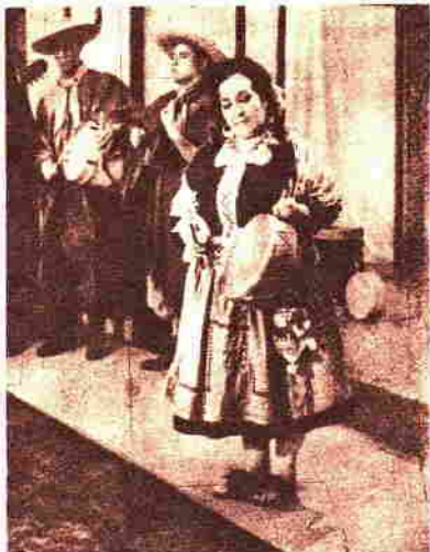
La inimitable Margarita Palacios creó con "Cantos en Belén" uno de las más bonitas canciones de la Navidad de nuestra tierra.