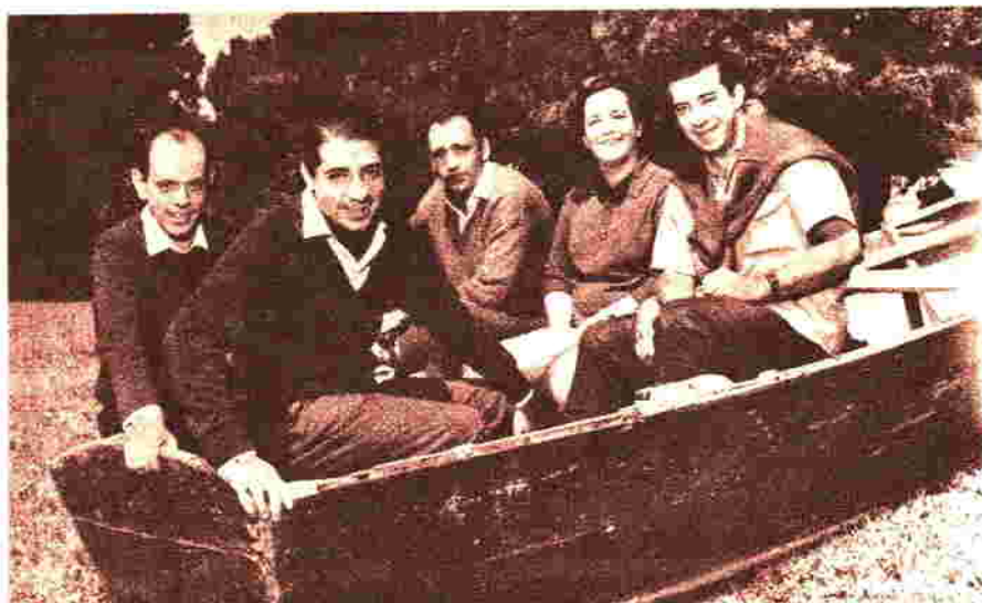
Una inolvidable creación de los Hijos de la Música: "Ay Nochebuena"; "Carito de barro luna y sol"