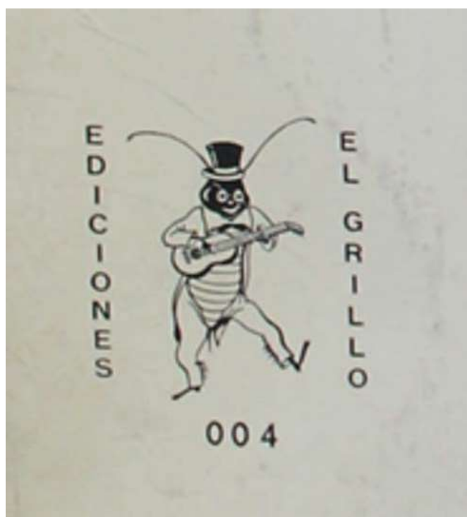
Figura 1: Logo El Grillo

El primer acercamiento al objeto-disco se produce con la observación de su diseño gráfico. Su tapa presenta, abajo a la izquierda, el logo del sello de Ediciones El grillo (la productora de Oscar Matus) con el número 004. Los números 001 y 002 habían correspondido a Canciones con fundamento de Mercedes Sosa (versión EP y LP respectivamente). El número 003 de la serie El grillo corresponde, siguiendo la misma lógica discográfica, al título de Ayala en versión EP.