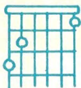
SOL 7 (DOMTE DO)