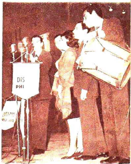
Los Huayra Puka. Cuatro varones y una niña. Llegaron para cantar en la Agrupación tradicionalista Los Gauchos de Güemes y luego ocuparon el escenario del Festival.

Terminaba la tercera noche del Primer Festival Latinoamericano y todas las banderas flameaban entrelazadas en los altos mástiles de la emoción.