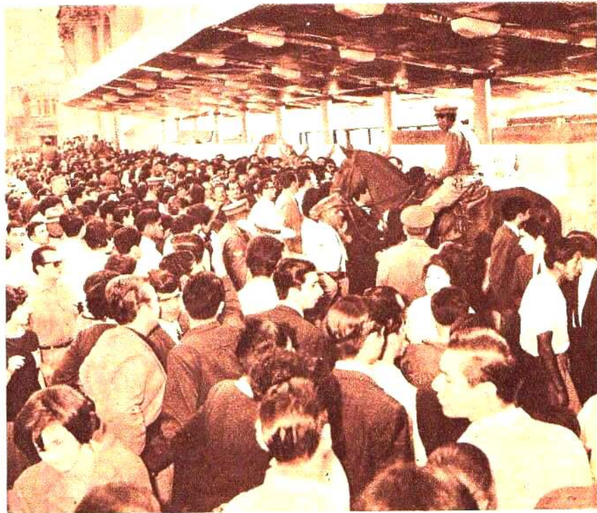
Una muestra elocuente del interés que despertó el Primer Festival Latinoamericano de Folklore. Enorme cantidad de público congregado frente a la entrada del Anfiteatro.