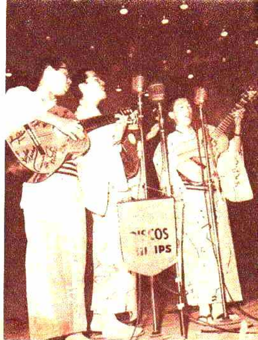
Tres voces de Japón aquerenciados en nuestro país que también dijeron presente en Salta: Los Cantores del Sol Naciente.