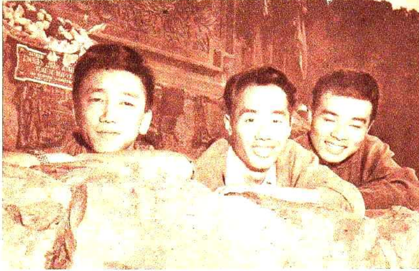
Los Cantores del Sol Naciente al pie del monumento a Güemes.