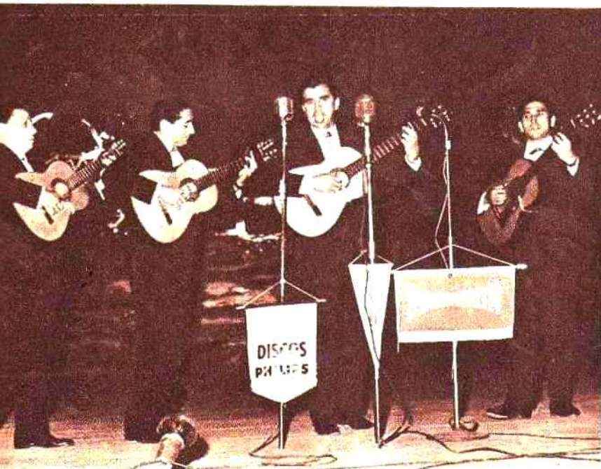
Los Cantores de Quilla Huasi se ganaron el corazón de los salteños en cada una de sus presentaciones, logrando repetir así el impacto logrado hace poco en Cesquín 65.