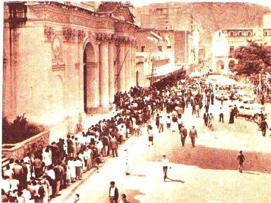
El interés del público fue realmente extraordinario. Desde hora temprana, largas colas de gente que esperaba el momento de tomar ubicación para no perder detalle.