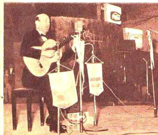
Eduardo Falú volvió a su tierra con el enorme prestigio acumulado con sus grandes triunfos en los escenarios del mundo.

Y la primera palabra musical de la noche se pronunció con acento salteño. Porque fueron Los de Salta los que rompieron el fuego. Y allí estaban Menú,