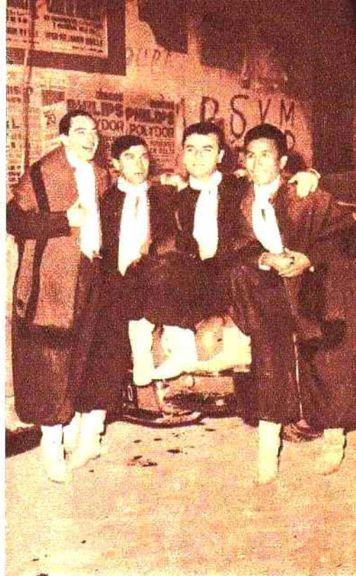
Las Voces del Huayra, conjunto que hace tiempo triunfara en Buenos Aires, volvió conservando su claro estilo de siempre.

La séptima noche desveló al Festival. La fiesta terminó a las 6.25 de la mañana y fueron Horacio Guarany y "Los Cantores de Quilla Huasi" sus melodiosos culpables. El festival a esa hora ya había prendido para siempre.