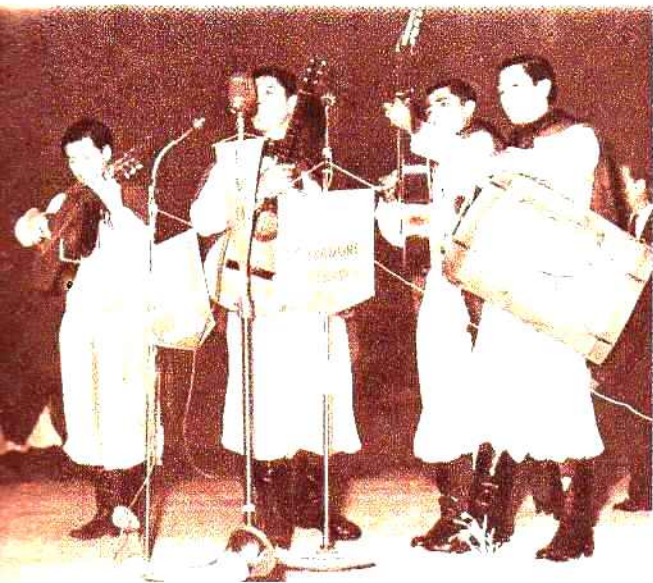
Es la tercera noche del Festival Latinoamericano de Folklore. Y Los de Salta cantan apenas iniciada la transmisión extraordinaria realizada por las ondas de LV9 Radio Güemes y LR3 Radio Belgrano