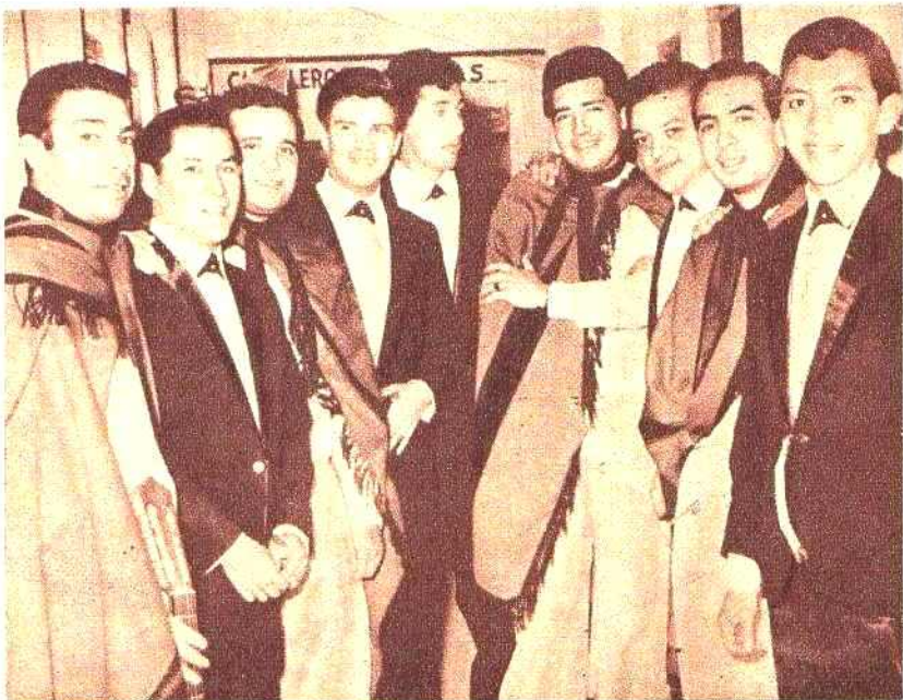
Dos juveniles conjuntos de Salta, Los Nombreadores, que siguen en pleno ascenso, y Los Puesteros de Yatasto, que de nuevo tomaron contacto con el gran aplauso público.