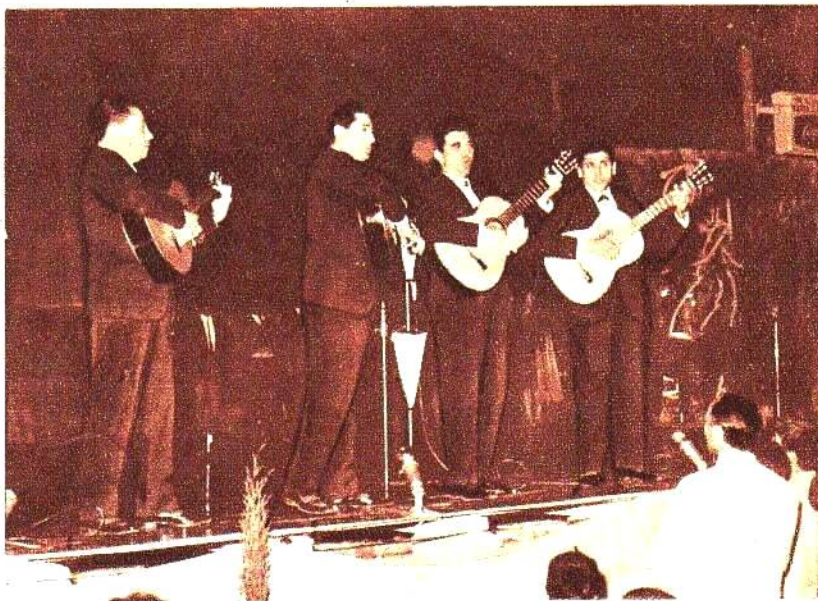
Es la última presentación de Los Cantores de Quilla Huasi y comienza a llover.