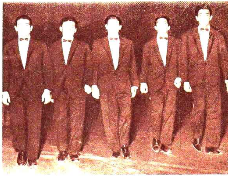
Cinco jóvenes santiagueños que arrancaron cálidos ap'ausos en el escenario latinoamericano de Salta. Los Huayna Canta es la denominación del conjunto, que promete consagrarse rápidamente.