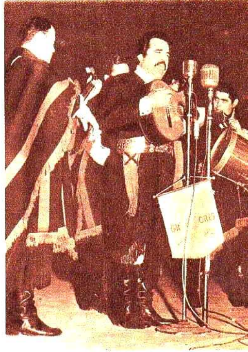
Cuando el grito se hace canto. Ninguna definición mejor para la voz de Guarany.