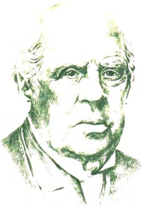
DOMINGO FAUSTINO SARMIENTO

Día 3. Año 1813. — San Martín da su primer combate en nuestro país, con sus "Granaderos a Caballo", en San Lorenzo, donde estuvo a punto de perder la vida. El soldado correntino Juan Bautista Cabral lo libró del caballo, que apretó, al caer, una pierna a San Martín. Y el soldado de San Luis, Juan Bautista Baigorria, entretanto, atacó con su lanza a un soldado realista que estaba a punto de herir a San Martín con la bayoneta.