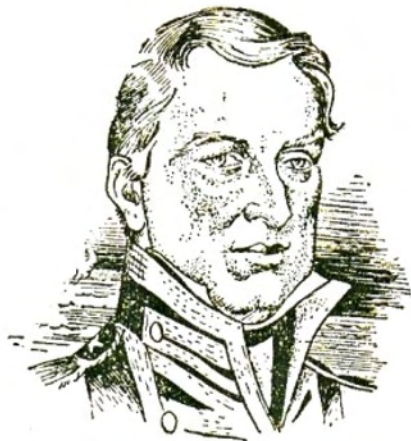
Almirante GUILLERMO J. BROWN