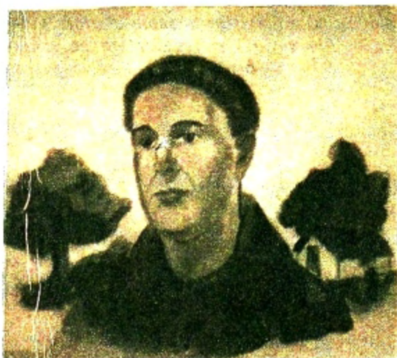
FRAY MAMERTO ESQUIU

Notorio era que después De porfiada resistencia Había aceptado la Silla Bajo el rigor de obediencia.