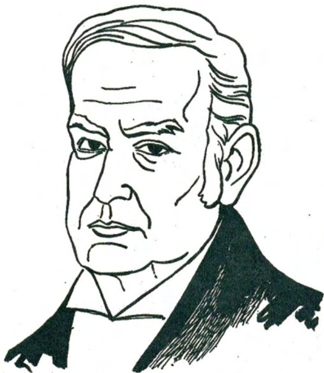
VICENTE LÓPEZ Y PLANES

...el primer gobierno independiente del Paraguay fue presidido por el jefe revolucionario Pedro Juan Caballero, instalado en la misma fecha?