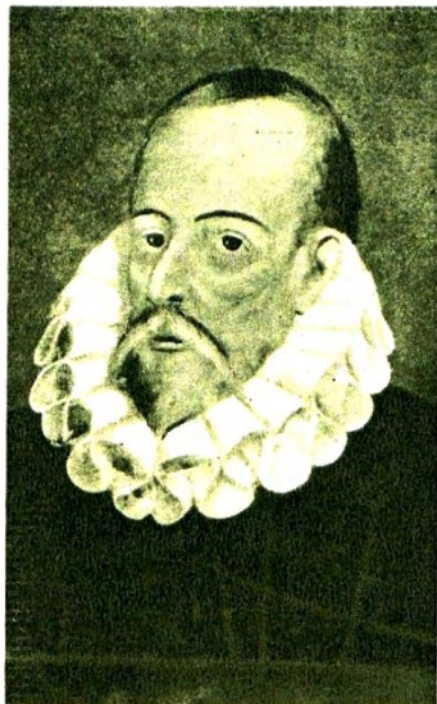
MIGUEL DE CERVANTES SAAVEDRA