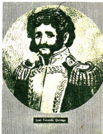
Juan Facundo Quiroga