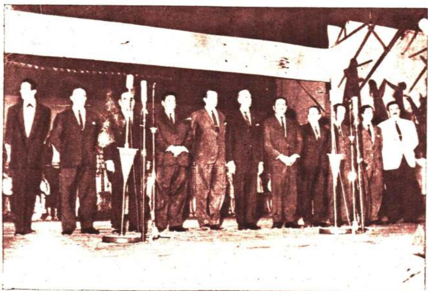
HIMNO NACIONAL ARGENTINO. Se escuchan las primeras estrofas. Escuchando atentamente vemos en la fotografía a los integrantes del Consejo de Administración de LASA rodeando al señor gobernador de Salta y al pie aparecen algunos integrantes de las delegaciones de Chile y México.