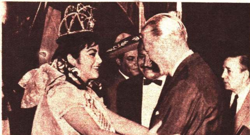
Santa Oviedo acaba de ser coronada por el general D'Andrea.