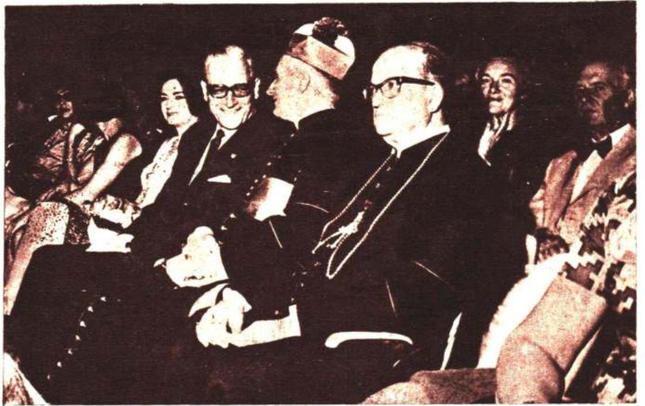
Estuvo todas las noches en el Latinoamericano acompañado por su señora esposa, Lucila Sueldo de D'Andrea.

Así trabaja el general Héctor D'Andrea por su provincia. Sin descanso. Y desde hora temprana. Esta labor no impidió que se acercara al estadio del Club Juventud de Salta el día que se inició el Campeonato Latinoamericano de Fútbol entre folkloristas a dar el puntapié inicial. Una actitud que despertó simpatías. Que nos permite asegurar que en Salta gobierna un hombre. Un señor. Como lo define la mayoría. Como nos impresionó a nosotros.