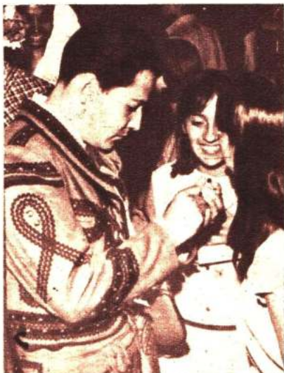
Los "mariachis" firmaron muchos autógrafos.