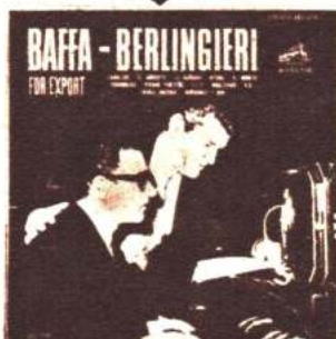
AVL-AVS 3718 BAFFA-BERLINGIERI FOR EXPORT CABULERO / EL ABRROJITO / LA GUIÑADA / RITUAL / EL MONITO / CHUMBICHA / VERANO PORTEÑO / CTV / BOULEVARD / TIERRA QUERIDA / BORDONEO Y 900.