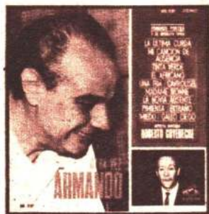
AVL-AVS 3721 ARMANDO PONTIER-ROBERTO GOVENECHÉ LA ÚLTIMA CURDA / LA NOVIA AUSENTE / TINTA VERDE / MI CANCIÓN DE AUSENCIA / EL AFRICANO / UNA FIJA / CARROUSEL / MADAME IVONNE / PIMIENTA / EXTRAÑO / MIEDO / GALLO CIEGO.