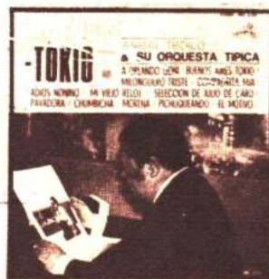
AVL-AVS 3724 ANIBAL TROILO BUENOS AIRES-TOKIO / ADIOS NONINO / A ORLANDO GOÑI / SELECCION DE JULIO DE CARO / EL MOTIVO / PICHUQUEANDO / MILONGUERO TRISTE / COMPADRITA MIA / CHUMBICHA / MORENA / PAYADORA / MI VIEJO RELOJ.

Y EN FOLKLORE ANUNCIAMOS UNA PRODUCCION ESPECTACULAR!