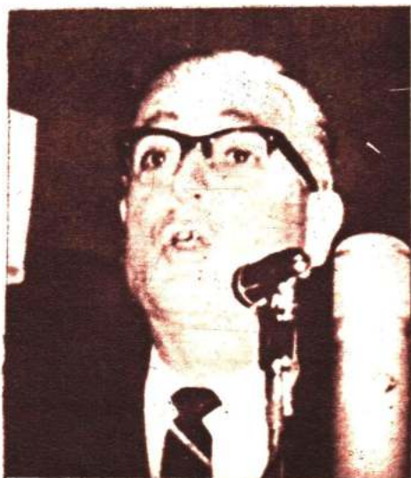
GOBIERNO. El general Héctor D'Andrea, gobernador de la provincia de Salta, habla en la apertura oficial del Festival.