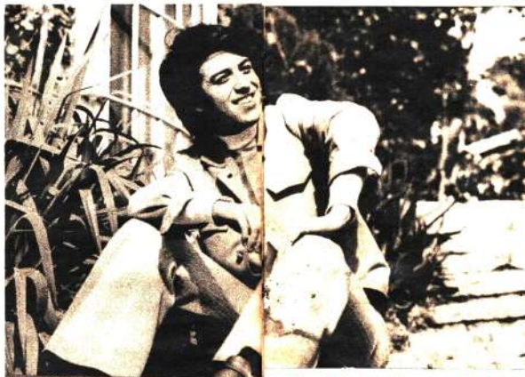
Donald: Pa, ma, racotá, sucundum, endecasilabos y el Tío Patillado.

"Yo he conocido cantores que era un gusto el escuchar, más no quieren opinar y se divierten cantando; pero yo canto opinando que es mi modo de cantar".