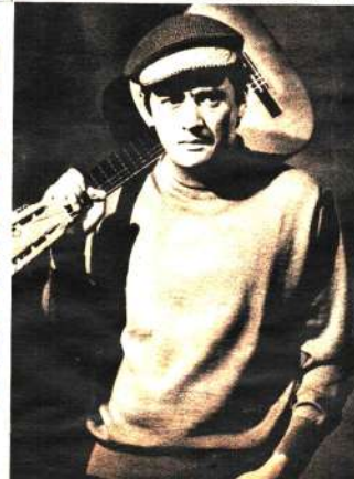
Palito: El modo con que el changuito cañero debe defender el sistema.